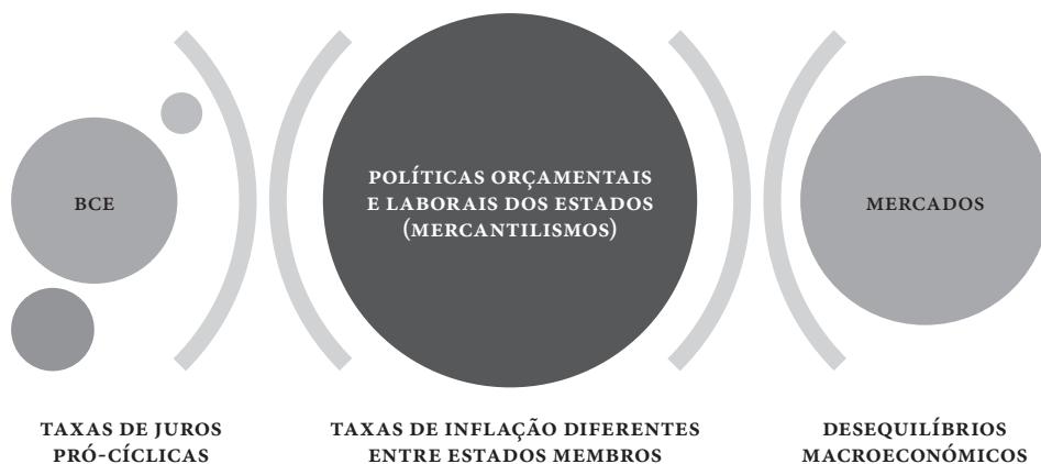
Esquema 1. Mecanismos estruturais na base da crise do euro

As condições criadas por estes fatores determinaram uma estrutura de incentivos que levou os investidores a desinvestir de forma repentina nos países cujas bolhas rebentaram em consequência da crise dos créditos subprime nos Estados Unidos em 2007-2008. O fenómeno de “sudden stop” foi facilitado pela rigidez das regras europeias, pela evidente falta de uma resposta coordenada e positiva dos países europeus, e finalmente pela escolha do Banco Central Europeu de praticar uma política monetária restritiva no momento em que a crise se manifestou 15 . Mais uma vez, as escolhas políticas dos membros do concerto europeu foram ditadas pela posição e os interesses dos próprios investidores nacionais no mercado internacional, por um lado, e pelas diferentes estratégias de longo prazo de adaptação ao mercado internacional (estratégias fortemente individuais e alheias tanto à cooperação quanto à partilha de riscos comuns), por outro.